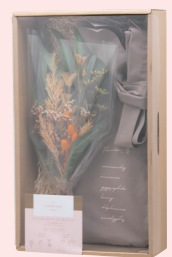
パッケージ L40 × W24 × D9