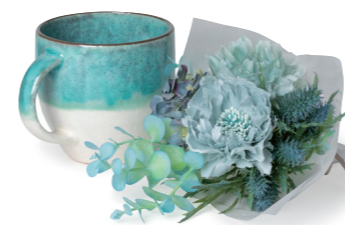
U-09020 フラワーマグとブルーのブーケ 4,980yen (税抜) 6コ/36コ フラワー: L21 W14 マグ: H8.3×W11 φ7.8 容量: 約330ml (ポリエステル・ポリエチレン・ペーパー・陶器)

色とりどりのアーティフィシャルフラワーと伝統的な美濃焼を組み合わせたフラワーマグセット。 とろけるような釉薬の質感と奥深い風合いが魅力的です。 マグたちに合わせた大人な色合いの花束を添えて。