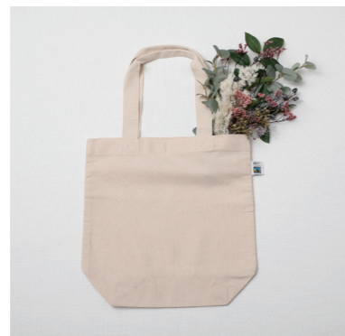
U-09006 トートバッグとモープのブーケ 4,700yen (税抜) 1コ/24コ フラワー:L38 W18 バッグ:L37.5×W37×D13.5 持ち手:L24 (プリザーブド・ドライ・ポリエステル・ポリエチレン・コットン)