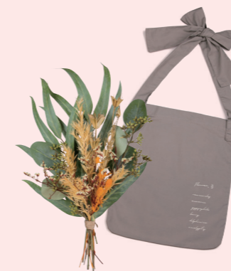
U-09013 結べるバッグと オレンジのブーケ 4,980yen (税抜) 1コ/24コ フラワー:L38 W18 バッグ:L36×W30 肩紐:L72 (ブリザーブド・ドライ・ ポリエステル・ポリエチレン)