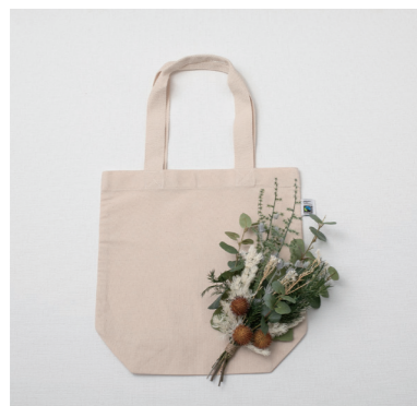
U-09005 トートバッグとブルーのブーケ 4,700yen (税抜) 1コ/24コ フラワー:L38 W18 バッグ:L37.5×W37×D13.5 持ち手:L24 (プリザーブド・ドライ・ポリエステル・ポリエチレン・コットン)