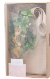
パッケージ L40 × W24 × D9