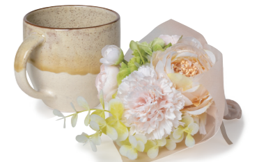
U-09021 フラワーマグとイエローのブーケ 4,980yen (税抜) 6コ/36コ フラワー: L21 W14 マグ: H8.3×W11 φ7.8 容量: 約330ml (ポリエステル・ポリエチレン・ペーパー・陶器)