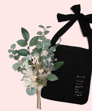
U-09012 結べるバッグと ホワイトのブーケ 4,980yen (税抜) 1コ/24コ フラワー:L38 W18 バッグ:L36×W30 肩紐:L72 (ブリザーブド・ドライ・ ポリエステル・ポリエチレン)