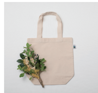
U-09007 トートバッグとイエローのブーケ 4,700yen (税抜) 1コ/24コ フラワー:L38 W18 バッグ:L37.5×W37×D13.5 持ち手:L24 (プリザーブド・ドライ・ポリエステル・ポリエチレン・コットン)