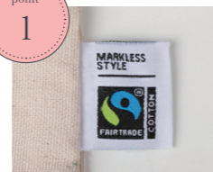
国際フェアトレード認証ラベル付き。