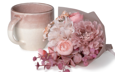
U-09019 フラワーマグとピンクのブーケ 4,980yen (税抜) 6コ/36コ フラワー: L21 W14 マグ: H8.3×W11 φ7.8 容量: 約330ml (ポリエステル・ポリエチレン・ペーパー・陶器)