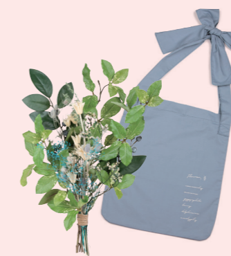
U-09014 結べるバッグと ブルーのブーケ 4,980yen (税抜) 1コ/24コ フラワー:L38 W18 バッグ:L36×W30 肩紐:L72 (ブリザーブド・ドライ・ ポリエステル・ポリエチレン)