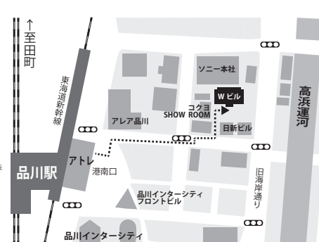
■東京ショールーム（アン・デコール）

東京都港区港南一丁目8番15号 Wビル1F TEL 03-6712-0506 FAX 03-6712-0516